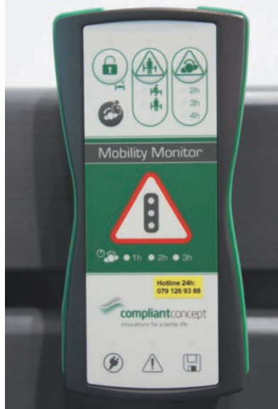
Abb. 2 (links) Der Mobilitätsmonitor am Bett zeigt den gemessenen Mobilitätsgrad in Form eines Ampelprinzips (grün, orange, rot) an

Das Display am Bettende (Abb. 2) zeigt permanent mit Hilfe einer Ampelstellung das aktuelle Mobilitätsmuster des Patienten an: Grün steht für eine gute Mobilität, orange für niedrige Mobilität und rot für stark verminderte Mobilität. Bleiben zum Beispiel relevante Bewegungen während einer einstellbaren Zeitdauer von zwei, drei oder gar vier Stunden aus, wird eine Warnung über den Lichtruf oder über andere, neuere technische Hilfsmittel ausgegeben. Die Mobilitätsdaten werden dabei laufend aufgezeichnet und las-