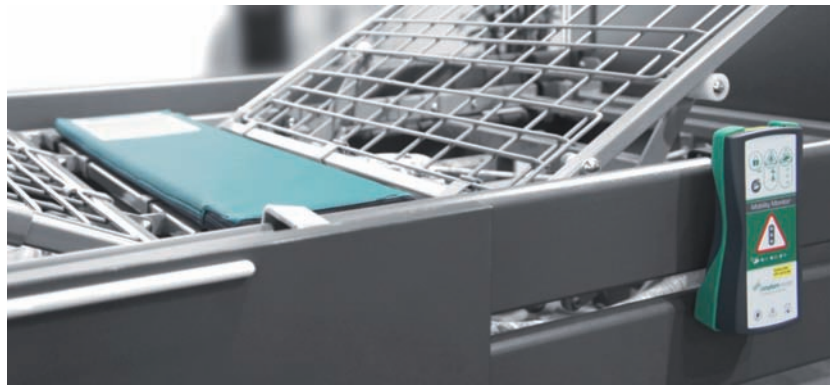
Abb. 1 (oben) Ein Sensor unter der Matratze erkennt berührungslos feinste Bewegungen und wertet diese aus

Eine Hightech-Sensorik unter der Matratze (Abb. 1) registriert berührungslos, also ohne Kontakt zum Körper des Patienten, feinste Bewegungen des Patienten und zeigt die gemessenen Werte auf einem kleinen Display am Bettende an. Die Messeinheit unterscheidet dabei zwischen relevanten und nicht relevanten Bewegungen. Als relevant werden jene Bewegungen definiert und einprogrammiert, die die jeweils durch den Auflagedruck belasteten Hautareale zu entlasten vermögen. Nicht relevante Bewegungen, zum